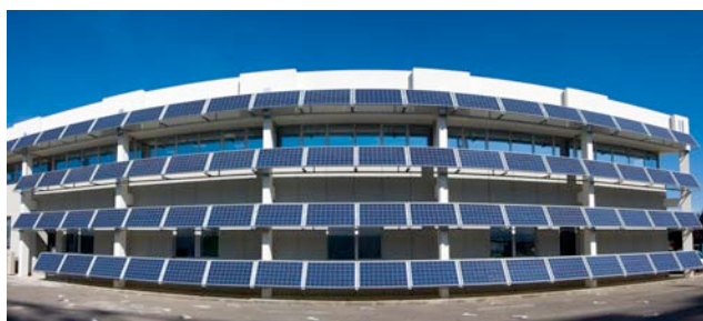
Le siège de la SHEM à Balma, près de Toulouse, est équipé de 94 panneaux photovoltaïques

Le Groupe inscrit la croissance responsable au cœur de ses métiers pour relever les grands enjeux énergétiques et environnementaux : répondre aux besoins en énergie, assurer la sécurité d'approvisionnement, lutter contre les changements climatiques et optimiser l'utilisation des ressources.